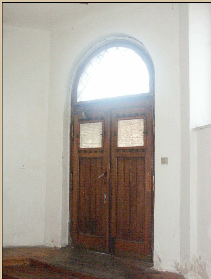
vnitřní pohled na dveře