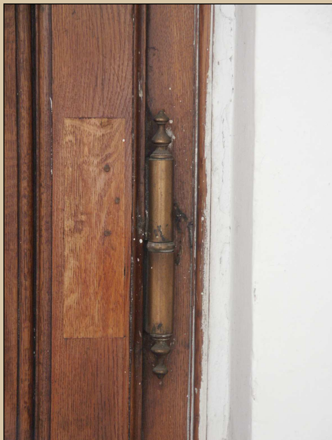
dveřní závěs s kuželkovými konci