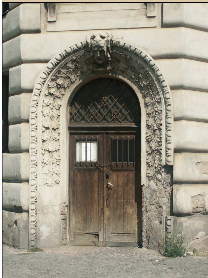
vnější pohled na portál s dveřmi